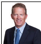
Guy Pope Desde Oct 11

Sociedad gestora: Threadneedle Man. Lux. S.A. Fondo de tipo paraguas: Columbia Threadneedle (Lux) I Categoría SFDR: Artículo 8 Fecha de lanzamiento: 12/10/11 Índice: - Grupo de comparación: - Divisa del fondo: USD Domicilio del Fondo: Luxemburgo Patrimonio total: €689,7m N.º de títulos: 74 Precio: 26,1848