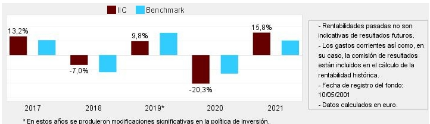
Gráfico rentabilidad histórica

Datos actualizados según el último informe anual disponible.