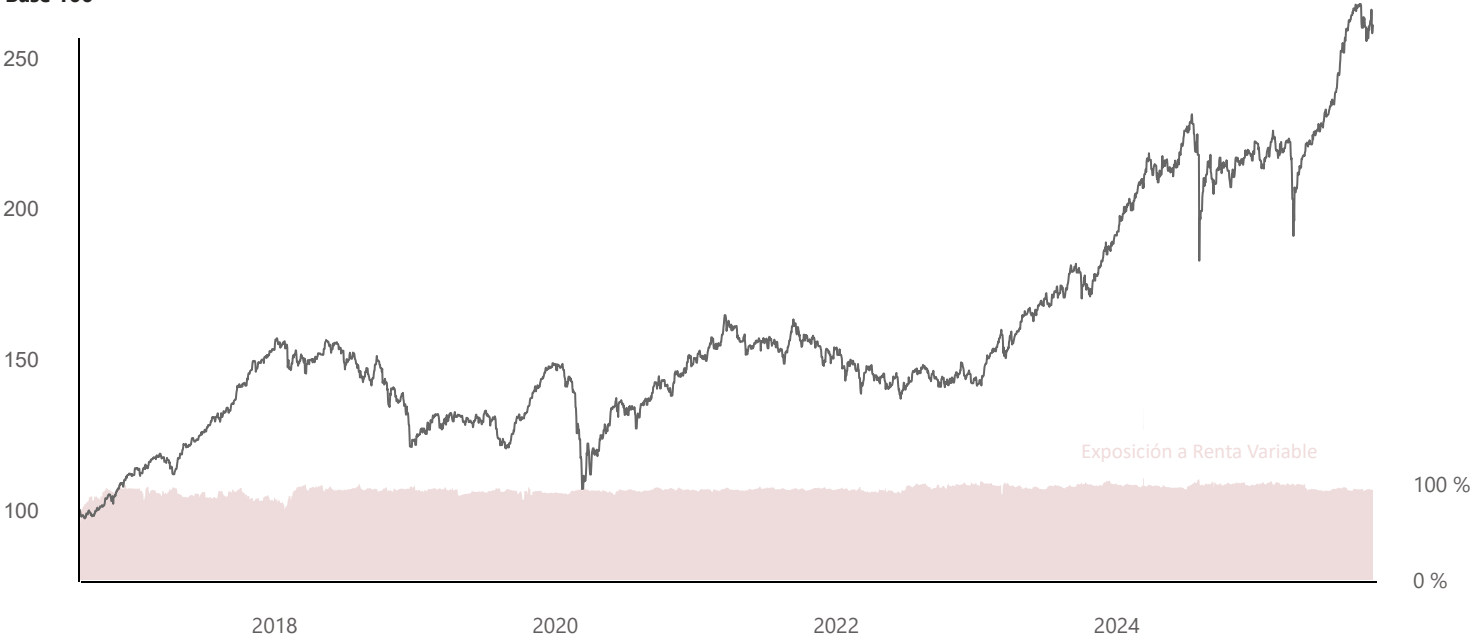
Japan Deep Value Fund FI Base 100

La exposición a la renta variable será como mínimo del 75%, exclusivamente en empresas japonesas, y no existirá límite en términos de su capitalización bursátil, principalmente se aplica una filosofía de `inversión en valor` seleccionando activos infravalorados, con alto potencial de revalorización. El resto se invertirá en renta fija que no tendrá límites en términos de calificación crediticia, o por tipo de emisor (público o privado), principalmente en mercados de la OCDE. La duración media de la cartera será inferior a siete años.