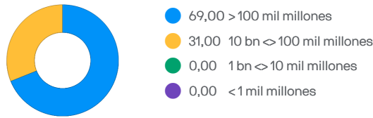
Cap. de mercado (%) (USD)

Las cifras indicadas pueden no sumar 100 debido al redondeo.